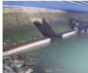
Exutoire du Trottebec dans le Port des Flamands