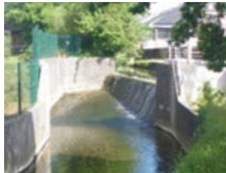
Déversoir et vannes barrage du Trottebec